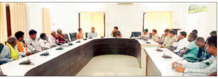
साथ मीटिंग की, जिसमें विभागीय गतिविधियों का जायजा लेते हुए लोगों की समस्याएं सुनी।

हरिभूमि न्यूज ►► बारनवापारा बार नवापारा वन अभ्यारण्य के गतिविधियों का जायजा लेते हुए लोगों की समस्याएं सुनी