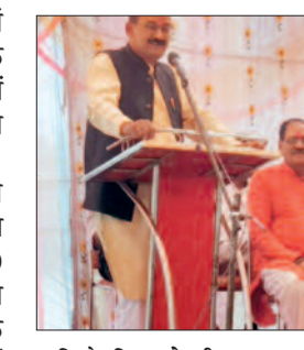
कृषि के लिए जो भी आवश्यक संसाधनों की जरूरत होगी, उसके लिए शासन की ओर से पूरा सहयोग मिलेगा। उन्होंने कहा कि किसानों की मांग पर कृषि उपकरण, उपचारित बीज सहित कृषि से संबंधित सामग्री उन्हें विभाग की ओर से प्रदान किया

किसान अपनी आय दुगुनी कर सकते हैं। उन्होंने कहा कि इसके लिए बीज का चयन, बीज उपचार, समय पर सिंचाई के साथ-साथ मिट्टी जांच कर उसमें आवश्यक पोषक तत्वों की कमी को दूर किया जाना जरूरी है। किसानों को उन्नत